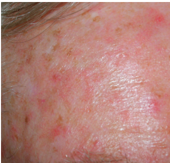
Nærbillede af en panderude med flere aktiniske keratoser og solskadet hud.

Aktiniske keratoser kan give anledning til kløe og irritation samt undertiden sårddannelse.