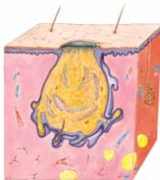
ÅBEN / SORT HUDORM

Er knap synlig men ses som små knopper på huden.