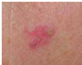
Bowens sykdom (plateepitelkreft in situ)