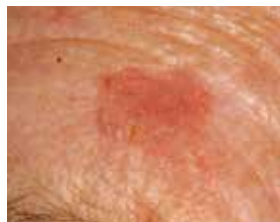
Enkeltstående aktinisk keratose