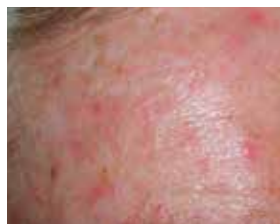
Felt av aktiniske keratoser