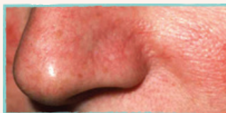
Små synliga blodkär i ansiktet