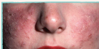
Torr, stramande eller irriterad hy i ansiktet