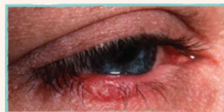
Vattniga, blodsprängda eller irriterade ögon, eller svullna ögonlock

Varje enskilt tecken eller symptom kan utvecklas från mildt till måttligt till svårt. Det är därför det är viktigt att få diagnos och behandling.