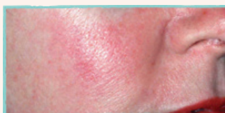
En tendens till att rodna ofta