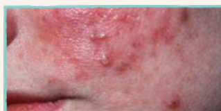
Utslag eller finnar i ansiktet