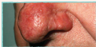
Rodnad eller förtjockad hud på kinderna, näsan och pannan