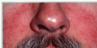
En brännande eller stickande känsla i ansiktet